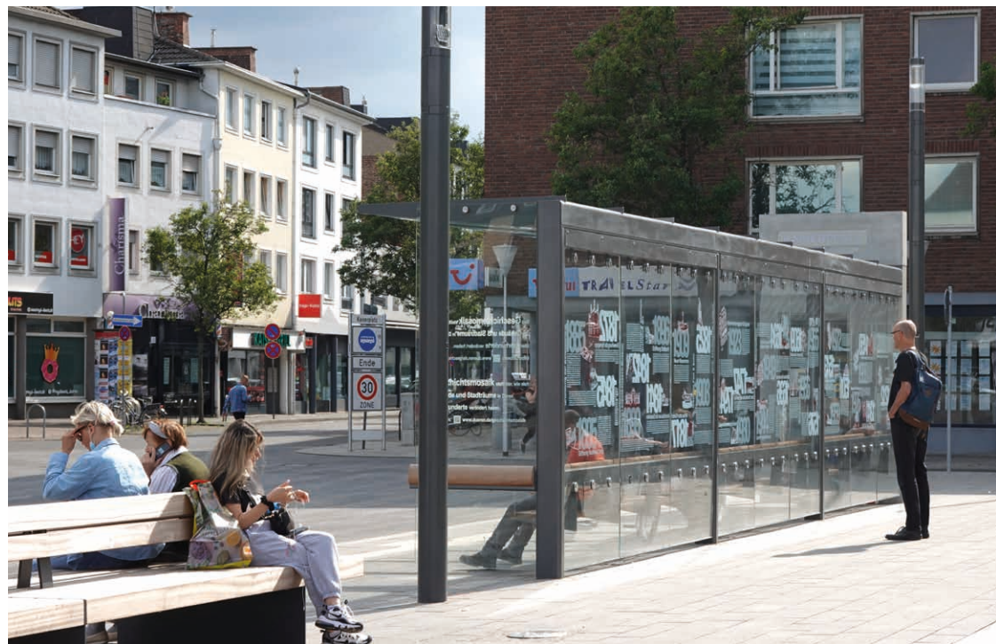
Neue Wartehalle mit Geschichtsmosaik