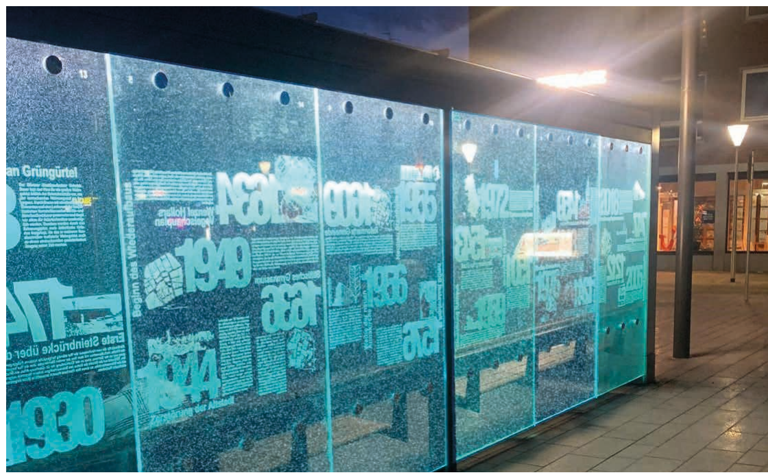
Abendliche Beleuchtung des Geschichtsmosaiks