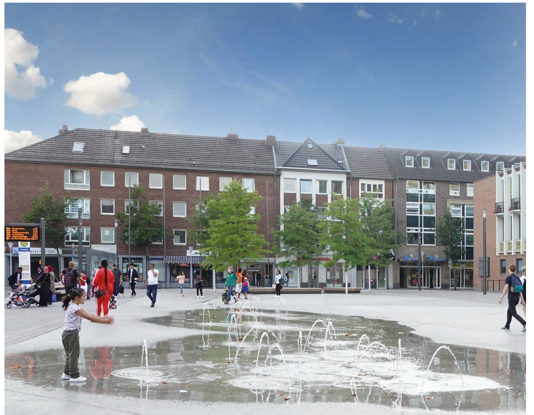
Der Kaiserplatz mit neuem „Gesicht“ - nun laden Wasserspiel und Sitzflächen unter lichtem Baumschatten zum Verweilen ein