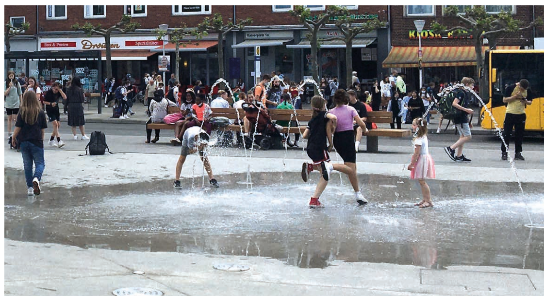
Wasserfontänen als Gestaltungselement und Spielort