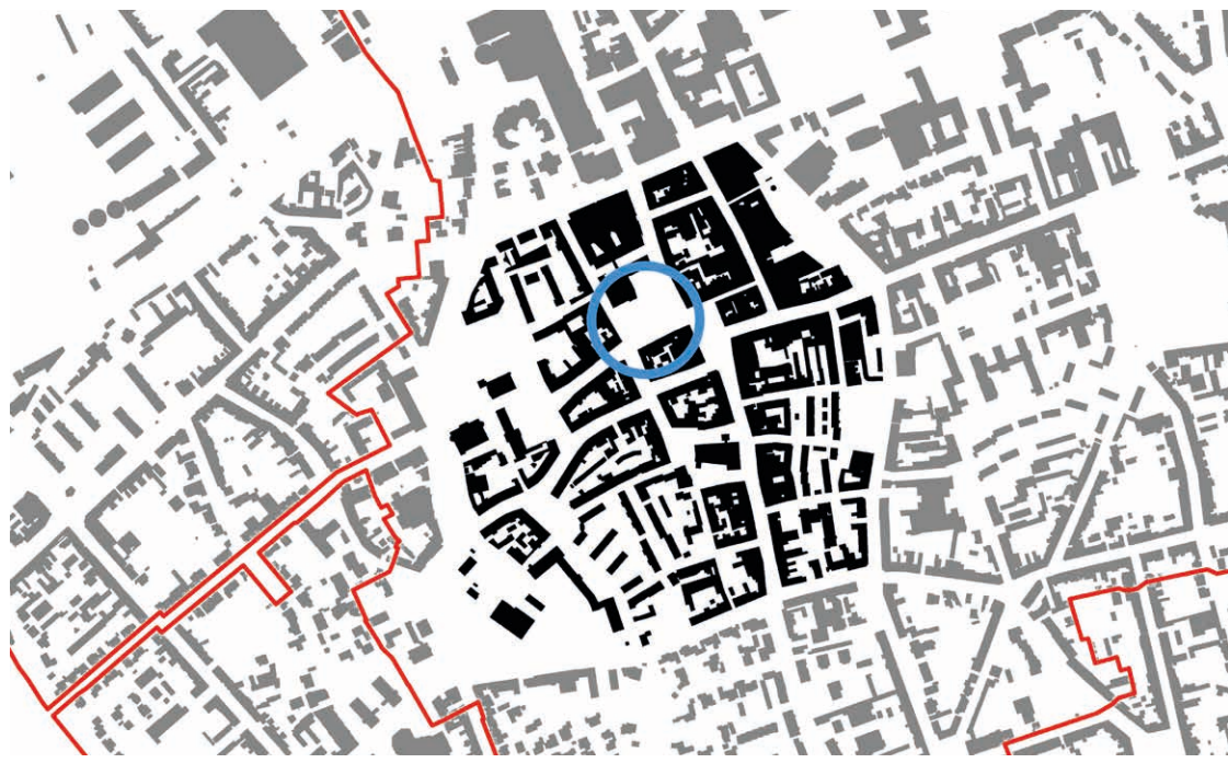
Übersichtsplan Innenstadt Düren