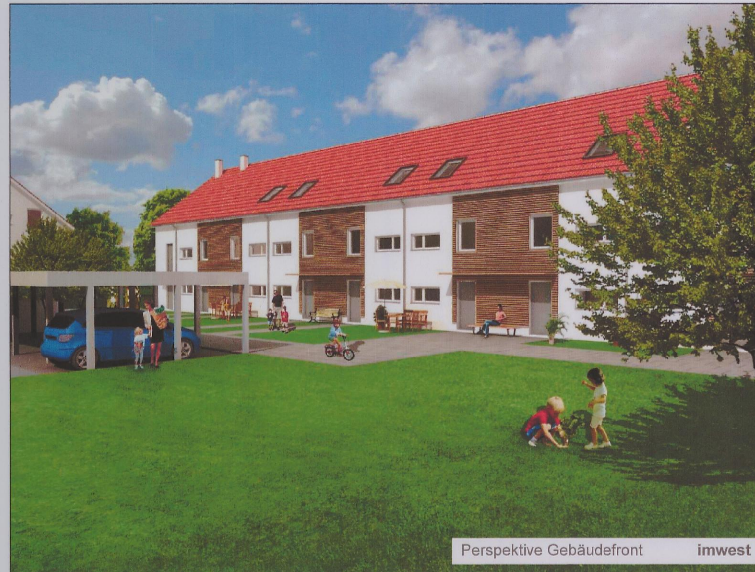
Perspektive Gebäudefront imwest