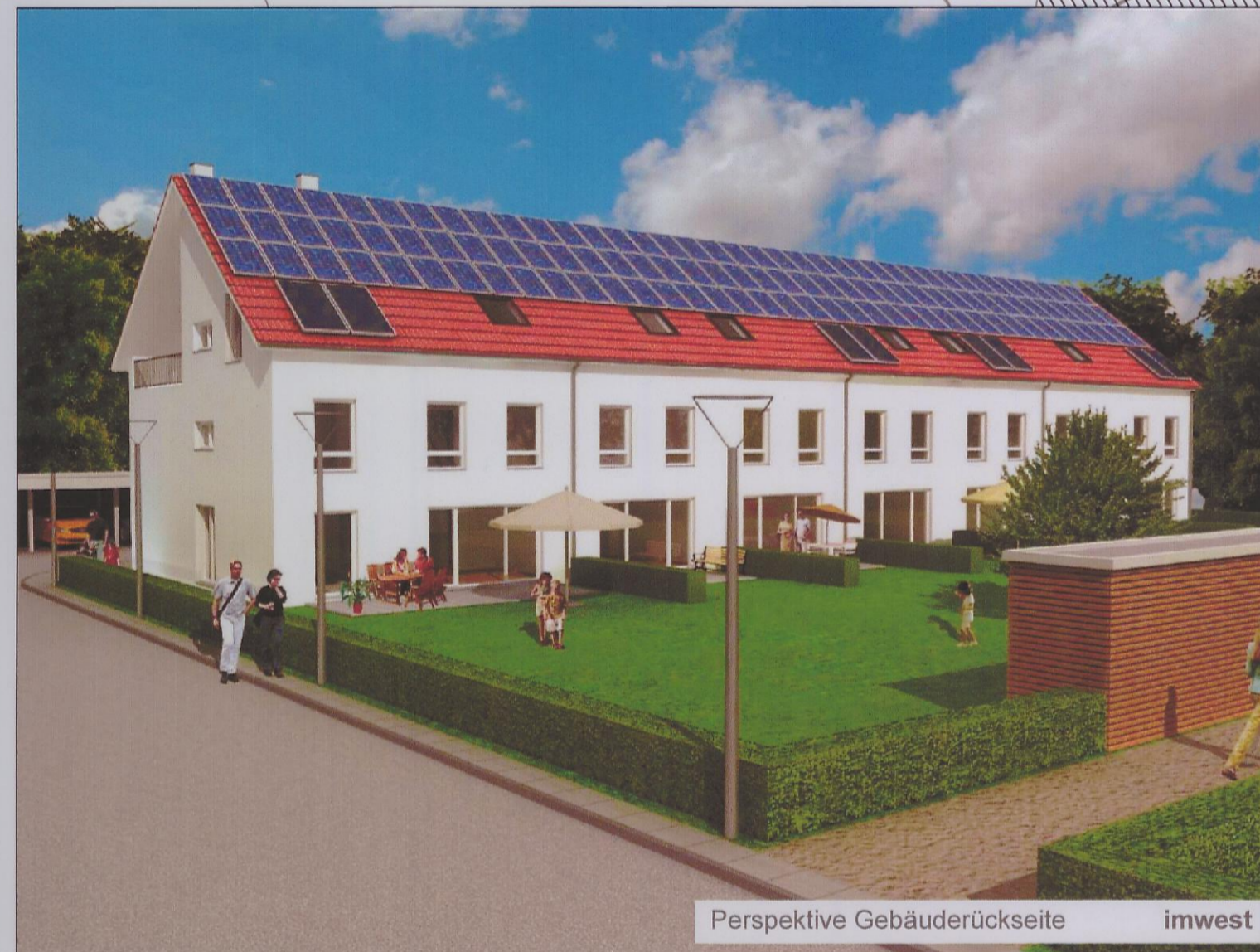
Perspektive Gebäuderückseite imwest