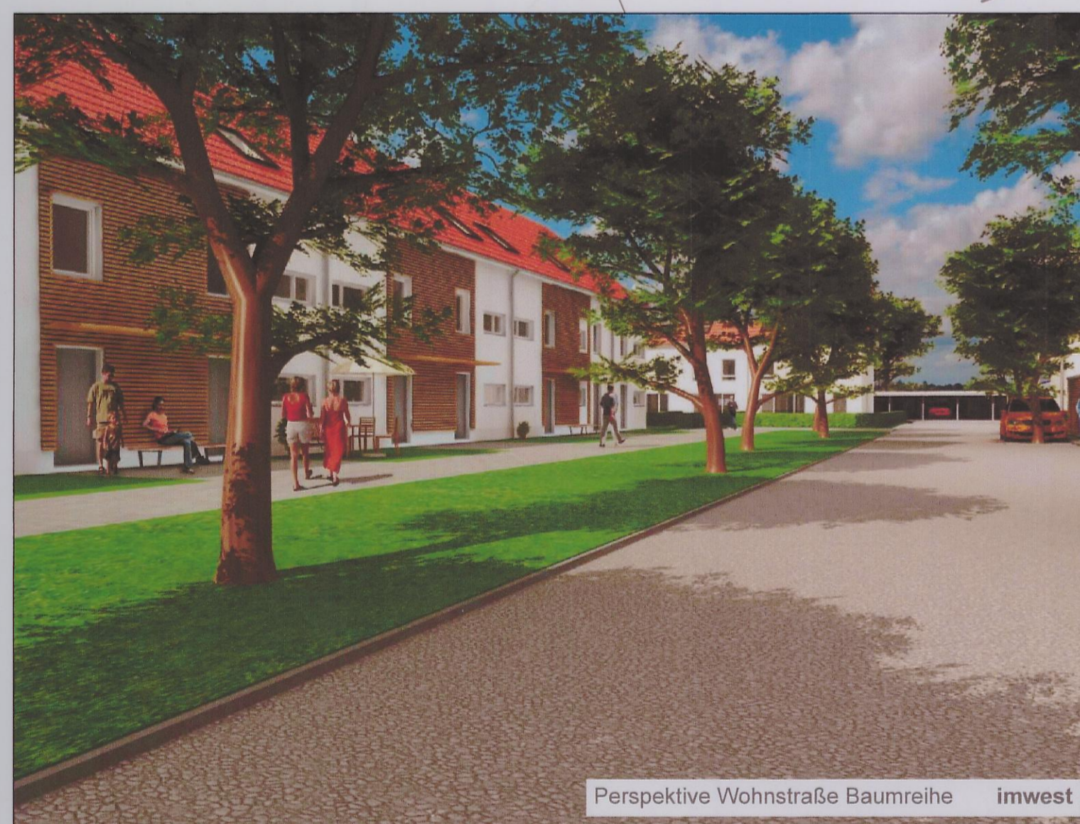
Perspektive Wohnstraße Baumreihe imwest